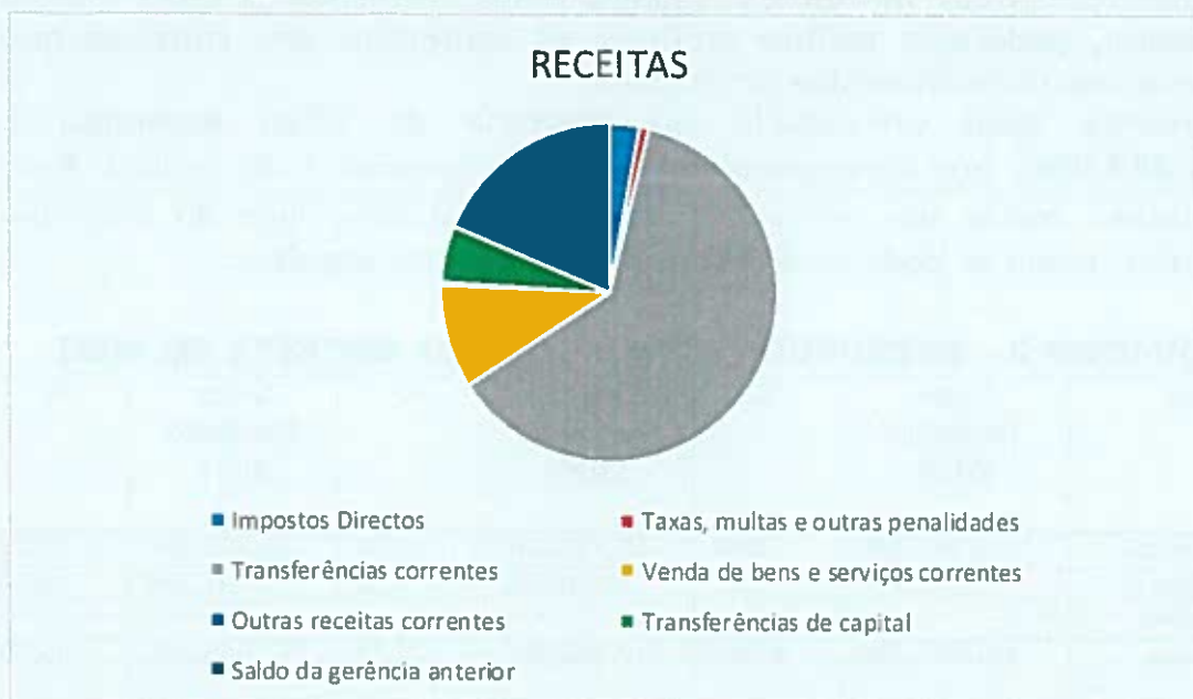
FIGURA 1 - PESO RELATIVO DE CADA CAPÍTULO NO ANO DE 2021 NO QUE CONCERNE AO TOTAL DAS RECEITAS

A independência financeira é aferida através do rácio que relaciona as receitas próprias com as receitas totais e, por isso, considera-se que existirá independência financeira se as receitas próprias representarem, pelo menos, 50% das receitas totais e tal como se verifica a União das Freguesias não é independente financeiramente.