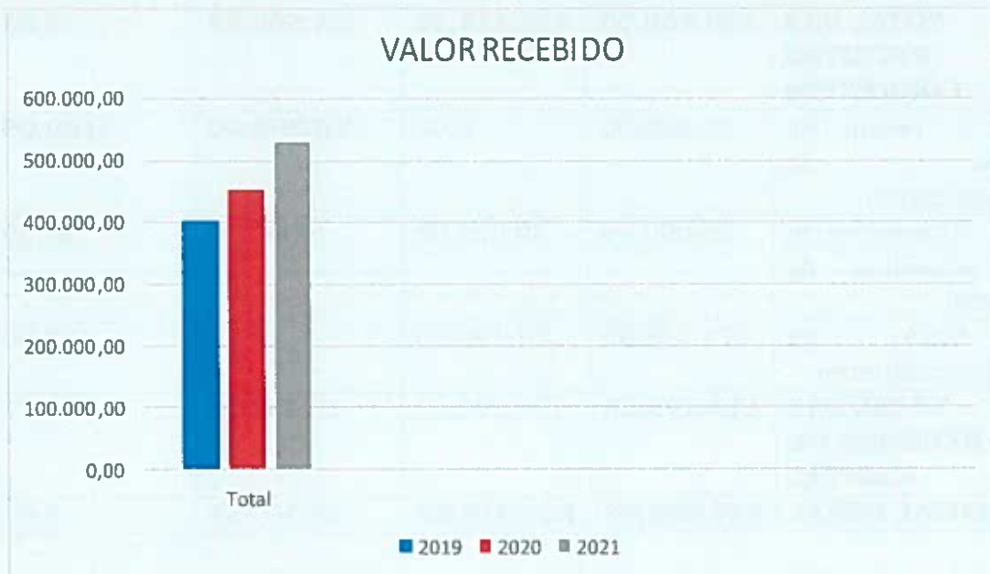
FIGURA 2 – TOTAL DAS RECEITAS EM 2019, 2020 E 2021

ATA Nº 17-2022 REUNIÃO ORDINÁRIA DE 04-04-2022